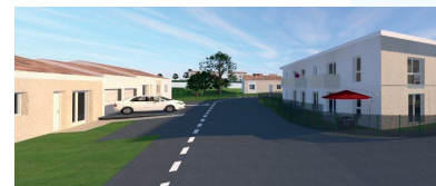
Coustette Vieille 42 logements Réalmon