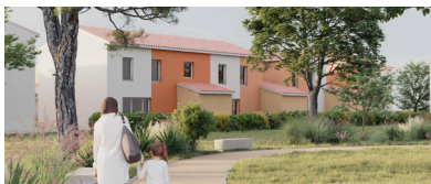
Les Demeures de la Pointe 11 logements Saint-Sulpice-La-Pointe

Davantage de logements, c'est davantage de familles accueillies.