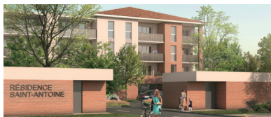
Saint-Antoine 60 logements Albi